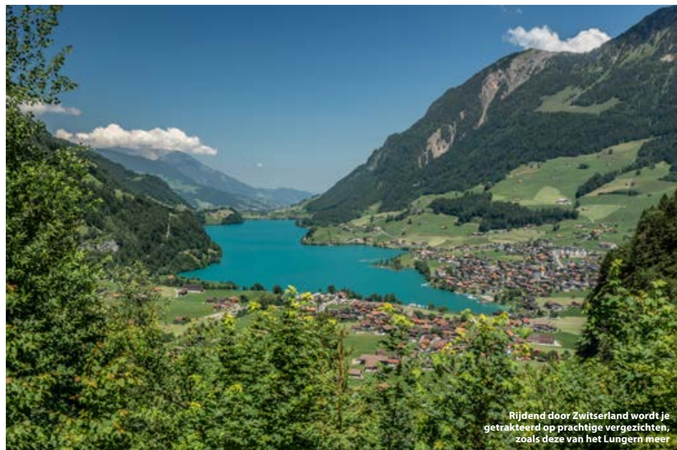
Rijdend door Zwitserland wordt je getraakteerd op prachtige vergezichten, zoals deze van het Lungern meer

natpak prima uit te houden is. We gaan via een geleidelijk hellende kust te water en tijdens de afdaling tikken we even de 12 meter aan. Hier is weinig leven dus we besluiten naar het ondiepe deel te zwemmen. Eenmaal daar aangekomen, bevind ik me al snel in een levendig ecosysteem vol met duizenden kleine baarsjes die beschutting zoeken tussen een oerwoud aan planten. De baarsjes zijn bepaald niet bang voor duikers en we kunnen dichtbij komen voor foto's. Op de bodem kruipen enkele invasieve krabbetjes en in de verte zie ik een enorme snoek voorbij schieten. Het zicht is met zo'n tien meter niet slecht en we genieten met volle teugen. Na de duik rijden we terug naar Bern waar we in het oude centrum onder het genot van een Zwitsers biertje napraten over de dag. De volgende ochtend ben ik vroeg uit de veren om mijn reis te vervolgen. De tweede stop heeft niet zo veel met duiken te maken, maar is desalniettemin zeer de moeite waard. Ik ga op weg naar Lauterbrunnen in het midden van Zwitserland. Dit dorpje is gelegen in een sprookjesachtige vallei met spectaculaire