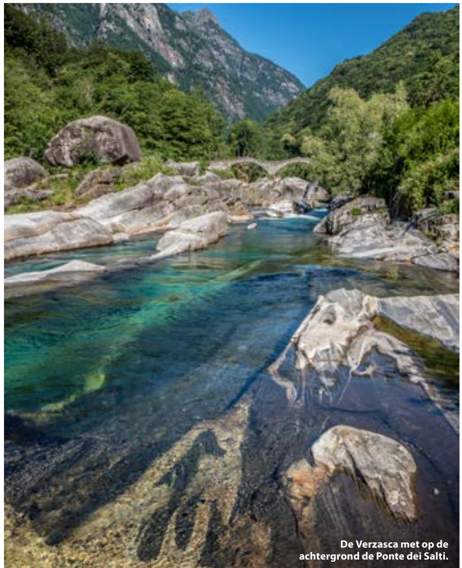
De Verzasca met op de achtergrond de Ponte dei Salti.

De wekker gaat weer vroeg de volgende ochtend. Vandaag staat een duik in de Maggia op de planning. Deze rivier bevindt zich ten westen van de Verzasca en de duikstek is slechts een kwartiertje rijden van het centrum van Locarno. De Maggia is iets breder waardoor het water wat langzamer stroomt. Het grote voordeel is dat het water dus langere tijd opgewarmd wordt door de zon en de temperatuur daardoor drie graden hoger is dan in de Verzasca. We gaan te water bij Pozzo di Tegna, een zandige oever aan de rivier die een populaire plek is voor zonzonbidders. Het is er dan ook erg druk en de mensen in zwemkleding kijken ons een beetje raar aan als wij helemaal bepakt het water in lopen. Het zicht is iets minder goed dan gisteren, maar nog steeds zo'n 20 meter dus we