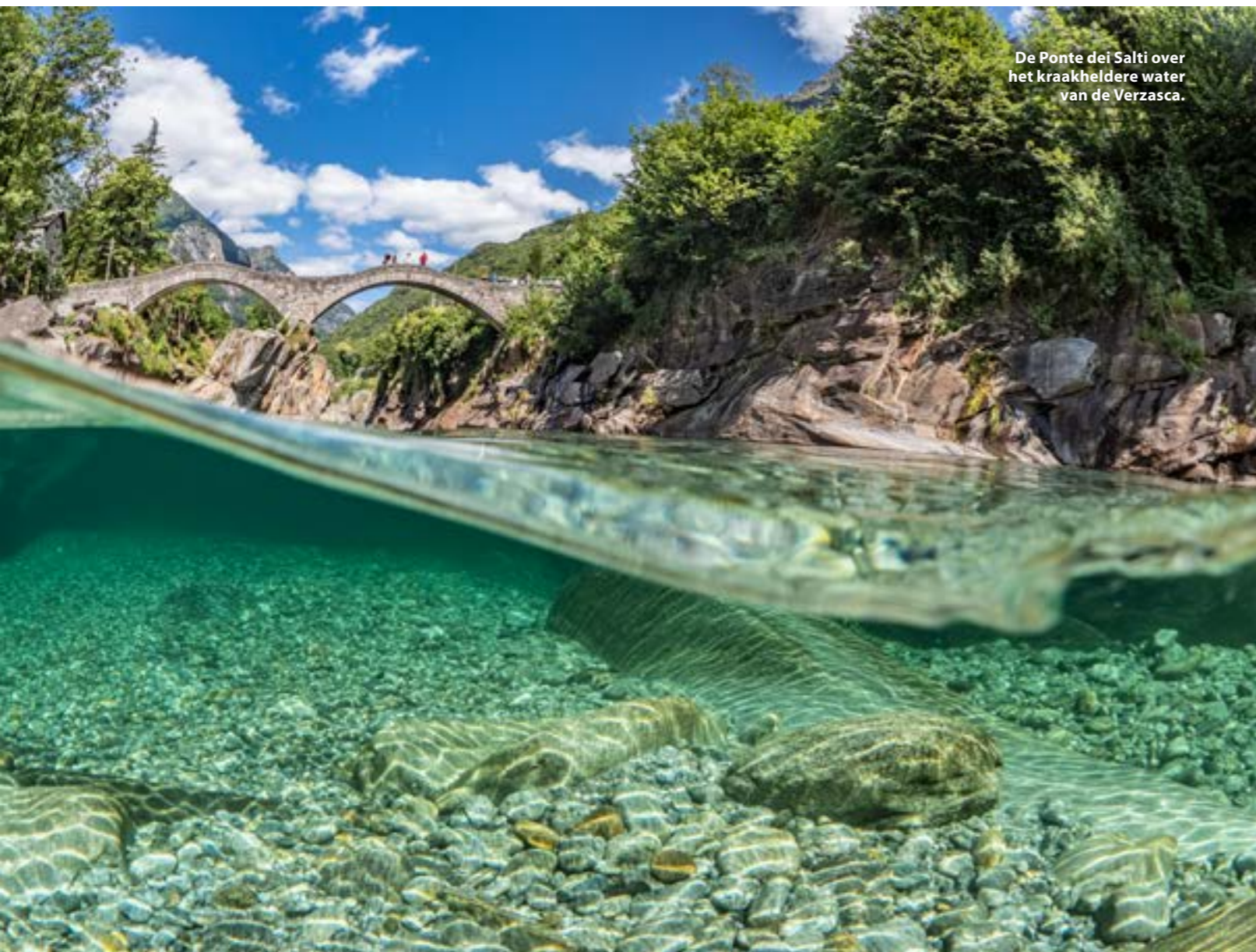
De Ponte dei Salti over het kraakheldere water van de Verzasca.

begeleiding duiken vaak nog bij sterkere stromingen, maar dit is af te raden, zeker als men de rivieren en het lokale weer niet door en door kent. Bij regen hogerop in de vallei kan in een mum van tijd een muur van water naar beneden komen die duikers verrast. Jaarlijks sterven er dan ook enkele duikers en zwemmers in de rivier. In de rivieren wordt gedoken met zo weinig mogelijk uitrusting. Ten eerste heb je met minder toeters en bellen een kleinere kans om in de stroming ergens achter vast te blijven haken. Ten tweede moet je voor, na of zelfs tijdens een duik soms een behoorlijk stuk klauteren over gladde rotsen en dit wil je met zo weinig mogelijk gewicht doen. Ondanks dat het water slechts 13 graden is, duiken we daarom in een natpak.