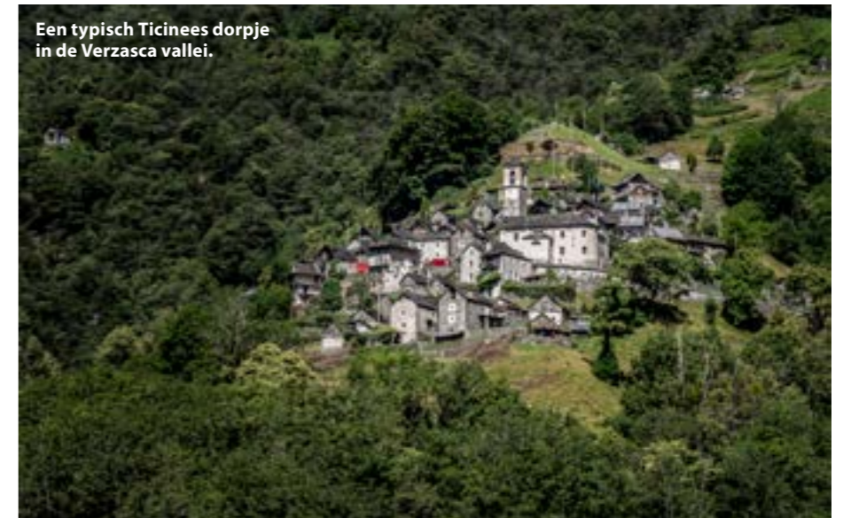
Een typisch Ticinees dorpje in de Verzasca vallei.

De duikstekken in de Verzasca liggen dicht bij elkaar. We wisselen van tanks en rijden in een paar minuten naar de volgende stek. Waar het bij de brug redelijk druk