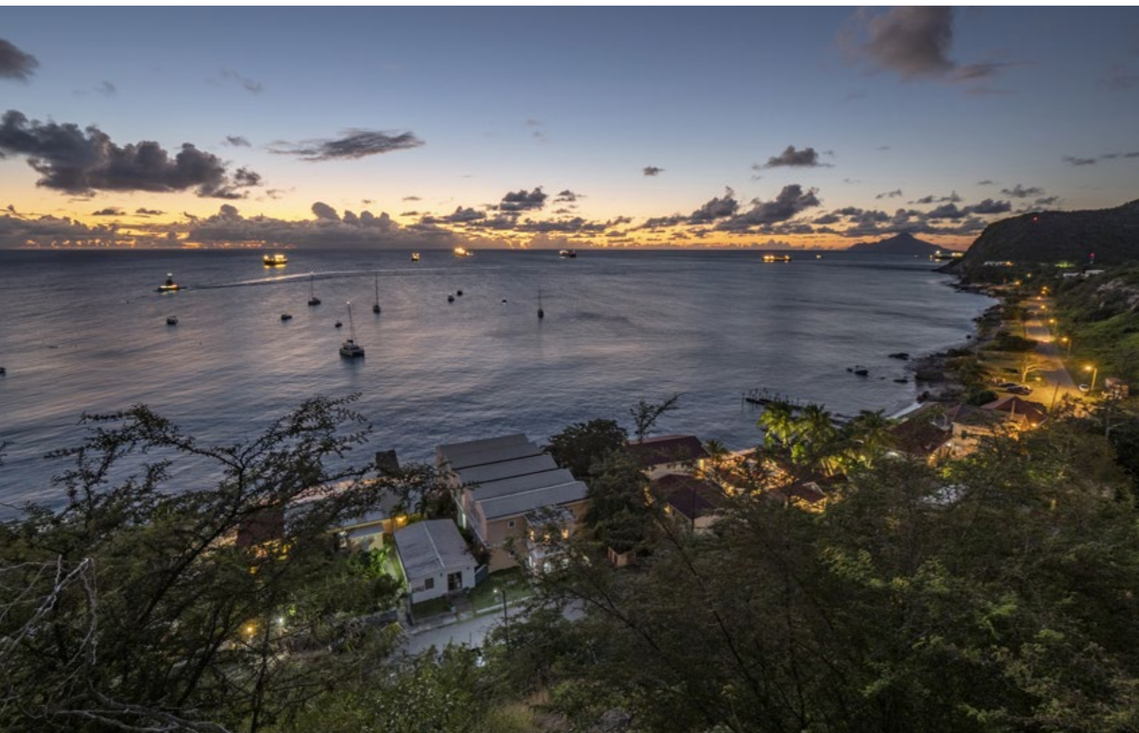
De Oranje Baai zoals hij nu is, met slechts een handjevol zeilboten en olietankers, staat in schril contrast met hoe het er twee eeuwen geleden uit moet hebben gezien. Aan de horizon het silhouet van het eiland Saba.

Het piepkleine Nederlands Caribische eiland Sint Eustatius, door de lokale bevolking ook wel Statia genoemd, kent een turbulente geschiedenis. Het eiland werd in 1636 door de Nederlanders gekoloniseerd met als doel suikerriet en andere tropische producten te verbouwen. Nadat bleek dat het eiland hier niet bijzonder geschikt voor was, werd het in 1756 een vrije doorvoerhaven waar goederen belastingvrij verhandeld konden worden. In de late achttiende eeuw gingen duizenden schepen per jaar voor anker op de rede van Sint Eustatius. Ze kwamen vanuit Europa, Noord-Amerika en het gehele Caribische Gebied om handel te drijven. Het eiland kreeg al snel de bijnaam Gouden Rots . Europese en Noord-Amerikaanse goederen en Afrikaanse slaven werden vanuit Statia met omringende eilanden verhandeld.