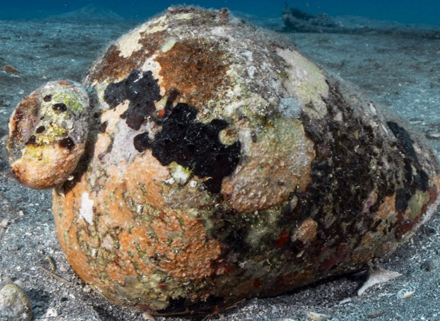
Een Spaanse olijfkruik op de bodem van Oranje Baai.