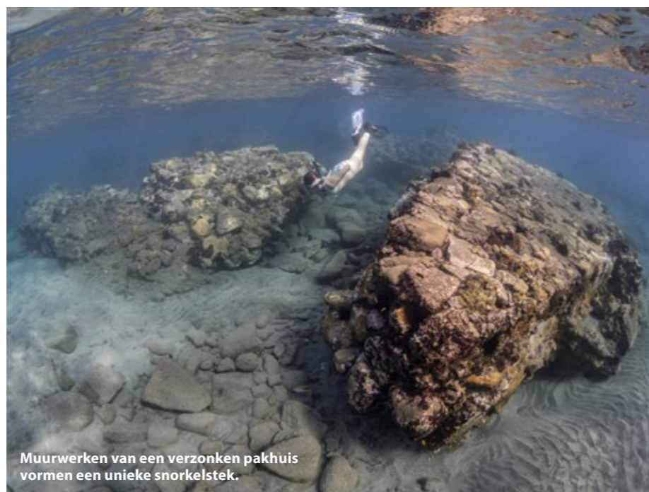
Muurwerken van een verzonken pakhuis vormen een unieke snorkelstek.

Het piepkleine Nederlands Caribische eiland Sint Eustatius, door de lokale bevolking ook wel Statia genoemd, kent een turbulente geschiedenis. Het eiland werd in 1636 door de Nederlanders gekoloniseerd met als doel suikerriet en andere tropische producten te verbouwen. Nadat bleek dat het eiland hier niet bijzonder geschikt voor was, werd het in 1756 een vrije doorvoerhaven waar goederen belastingvrij verhandeld konden worden. In de late achttiende eeuw gingen duizenden schepen per jaar voor anker op de rede van Sint Eustatius. Ze kwamen vanuit Europa, Noord-Amerika en het gehele Caribische Gebied om handel te drijven. Het eiland kreeg al snel de bijnaam Gouden Rots . Europese en Noord-Amerikaanse goederen en Afrikaanse slaven werden vanuit Statia met omringende eilanden verhandeld.