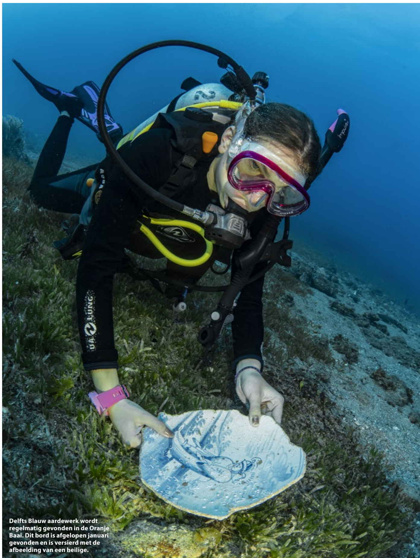
Delfts Blauw aardewerk wordt regelmatig gevonden in de Oranje Baai. Dit bord is afgelopen januari gevonden en is versierd met de afbeelding van een heilige.

met pakhuizen, koopmanshuizen, bordelen en tavernes. Na een lange reis kwamen zeelieden hier aan wal om stoom af te blazen. Historische bronnen beschrijven de benedenstad als een plek waar stevig werd gedronken, gerookt en gegokt. Regelmatig vonden gevechten en ongeregelde plaatsen, en maakte je het te bont, dan stond een galg voor je klaar aan het einde van de stad. Het was ook de plek waar je alles kon kopen wat je maar kon bedenken, van alle uithoeken van de wereld. De pakhuizen waren vaak tot de nok toe gevuld en suiker en katoen werden door een gebrek aan plek zelfs in de openlucht opgeslagen.